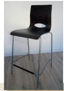
LINUS 95 cm 65 cm 40 cm 38 cm